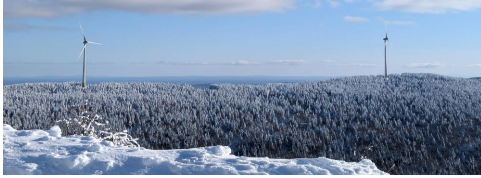
(Parc éolien de Saint-Philémon, Québec)